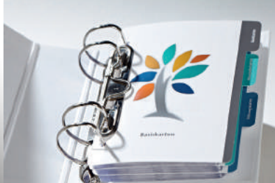
Ringbuch mit Register/PVC-Hüllen