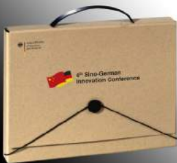
Koffer mit Tragegriff/Gummischließe

Diese und weitere kreative Lösungen finden Sie auf unserer Internetseite